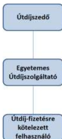
1. ábra - Útdíjszedő, az Egyetemes Útdíjszolgáltató és az Útdíj-fizetésre kötelezett felhasználó közötti szerződéses viszony

Az Útdíjszedő, az Egyetemes Útdíjszolgáltató és az Útdíj-fizetésre kötelezett felhasználó közötti szerződéses viszonyt az alábbi ábra szemlélteti: