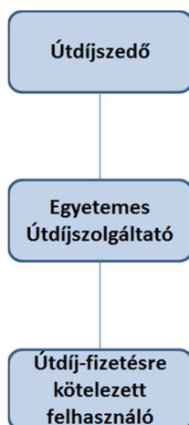
1. ábra - Útdíjszedő, az Egyetemes Útdíjszolgáltató és az Útdíj-fizetésre kötelezett felhasználó közötti szerződéses viszony

Az Útdíjszedő, az Egyetemes Útdíjszolgáltató és az Útdíj-fizetésre kötelezett felhasználó közötti szerződéses viszonyt az alábbi ábra szemlélteti: