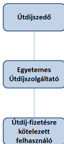
1. ábra - Útdíjszedő, az Egyetemes Útdíjszolgáltató és az Útdíj-fizetésre kötelezett felhasználó közötti szerződéses viszony

Az Útdíjszedő, az Egyetemes Útdíjszolgáltató és az Útdíj-fizetésre kötelezett felhasználó közötti szerződéses viszonyt az alábbi ábra szemlélteti: